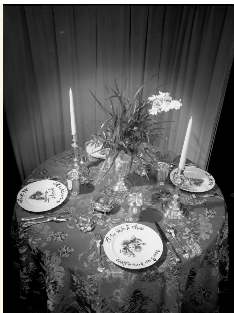
Les assiettes de Lise Deharme et Leonor Fini mises en scène dans l'expo surréaliste de Christofle, Paris, 1972

Pour l'inauguration du Pavillon Christofle, qu'il venait de réaménager au 12 de la rue Royale en 1942, Moreux organisa une exposition : 50 Tableaux et 50 Assiettes décorées par des peintres contemporains .