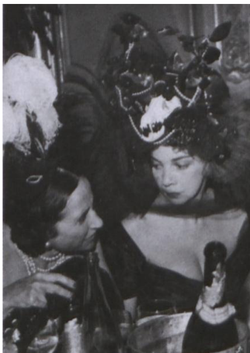
Lise Deharme et Leonor Fini au Bal du Panache, 1947